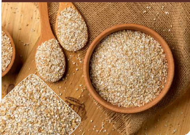
Крупа гречана "Проділ"